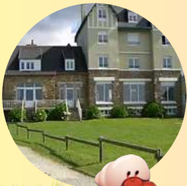
Le centre "Ker Avel" À Plougasnou (29)