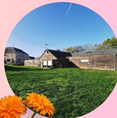
Le centre "La Charnie" À Torcé-Viviers-en Charnie (53)