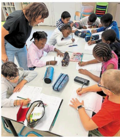
Les élèves ont fait des révisions avec des enseignants le matin.

En partenariat avec les Pep 53 (L'association départementale des Pupilles de l'enseignement public de la Mayenne), la ville de Laval, et la Ligue de l'enseignement, les actions intègrent des enseignants volontaires pour le soutien scolaire. « Il y a l'alternance entre l'approche