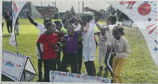
Les Lavallois ont remporté la finale régionale du Tournoi des quartiers et campagnes, jeudi 22 août.

« Franchement, c'est super cool, on va passer deux jours à Marcoussis », se réjouit l'éducateur spécialisé, ancien troisième ligne du Rugby club lavallois. Organisé par la Fédération française de rugby (FFR), ce tournoi a pour projet