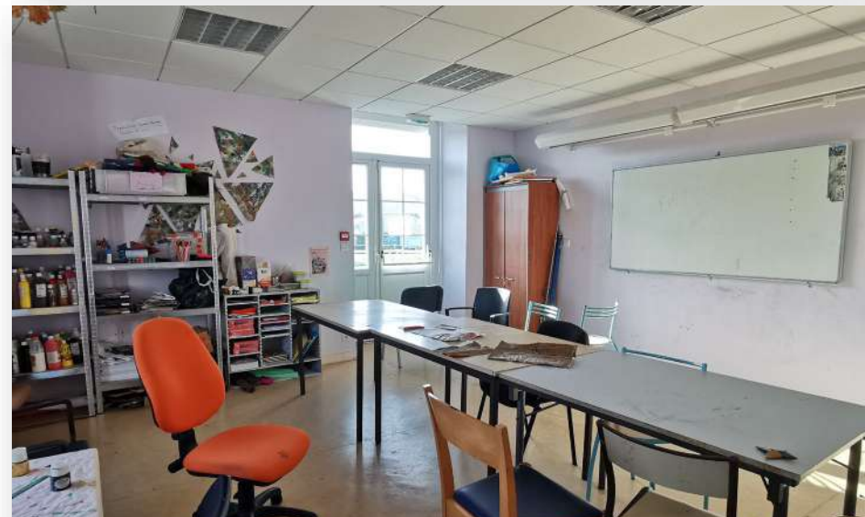
Salle « Peinture »