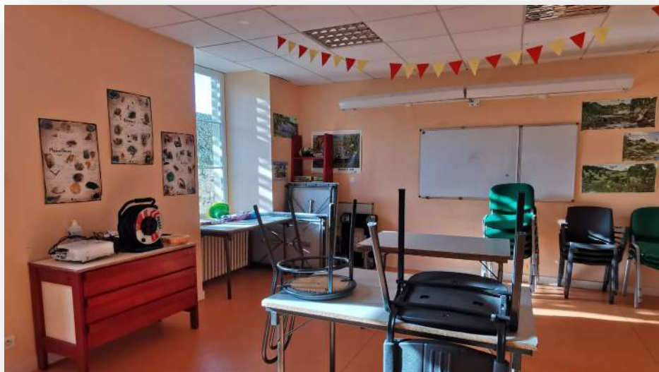
Une salle d'activité