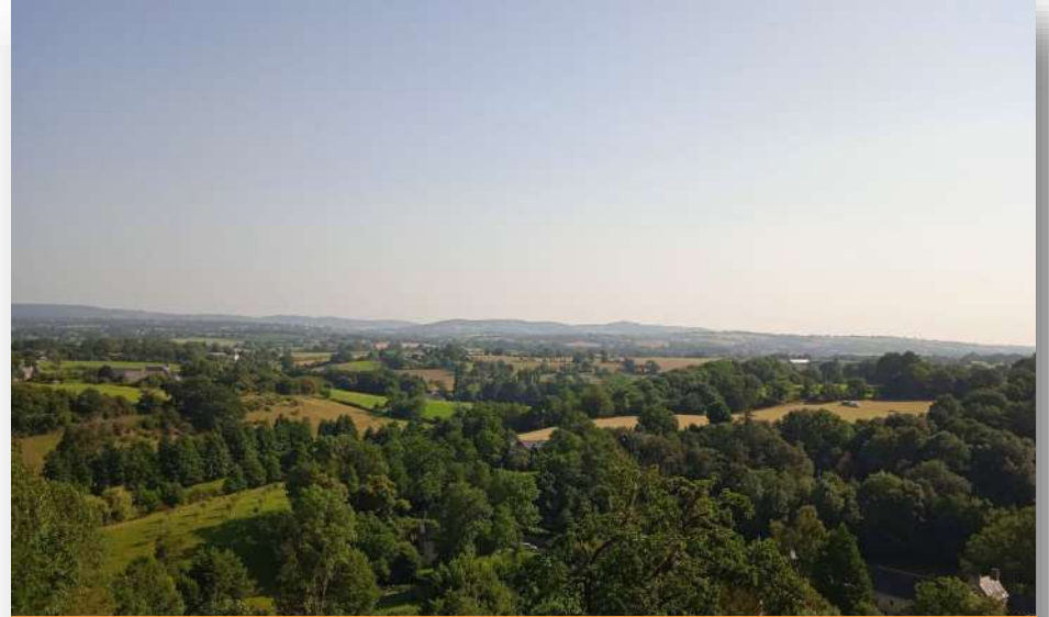
Forêt de Torcé-Viviers-en-Charnie