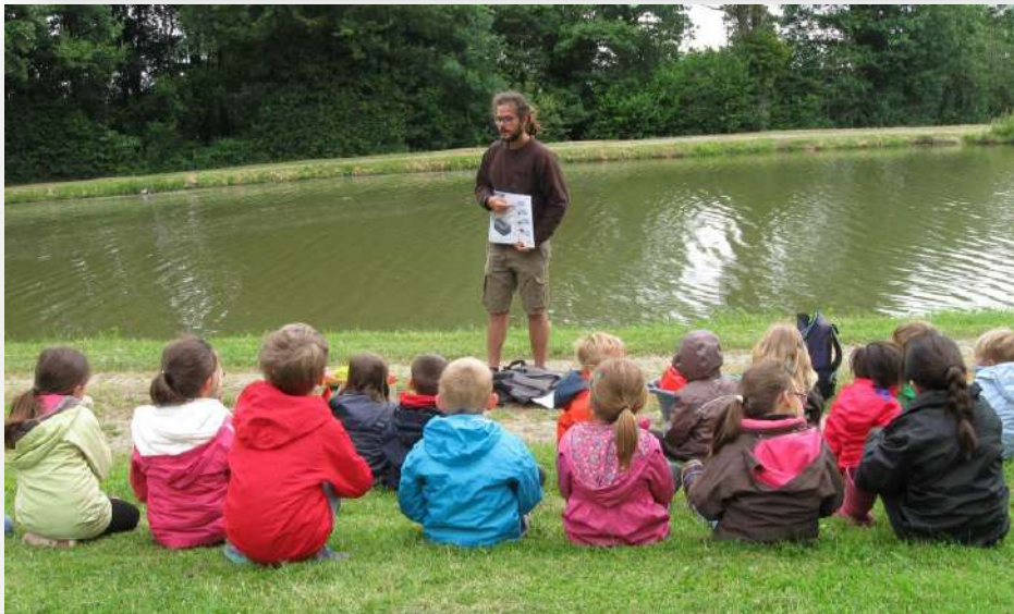
La Mare de Torcé-Viviers en Charnie