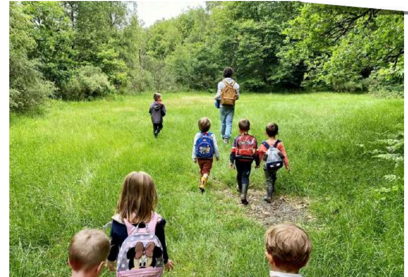
Classe de découverte