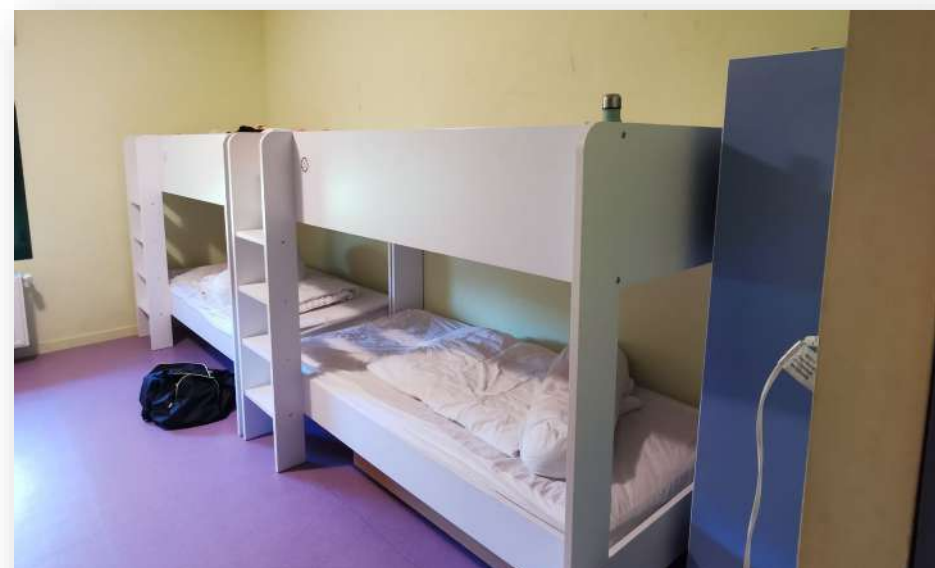
Photo d'une chambre