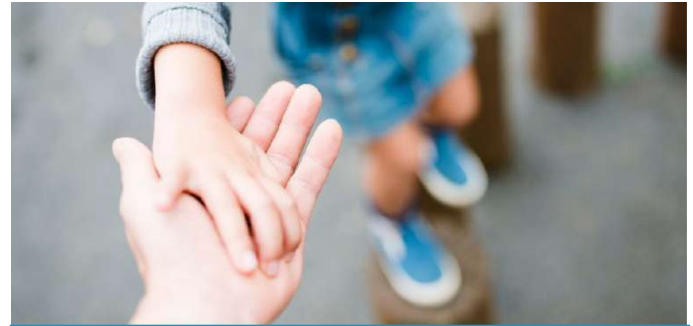
L'inclusion des enfants en situation de handicap