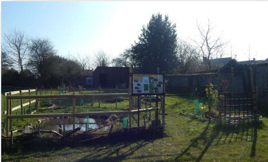
Le jardin (en cours de réaménagement)