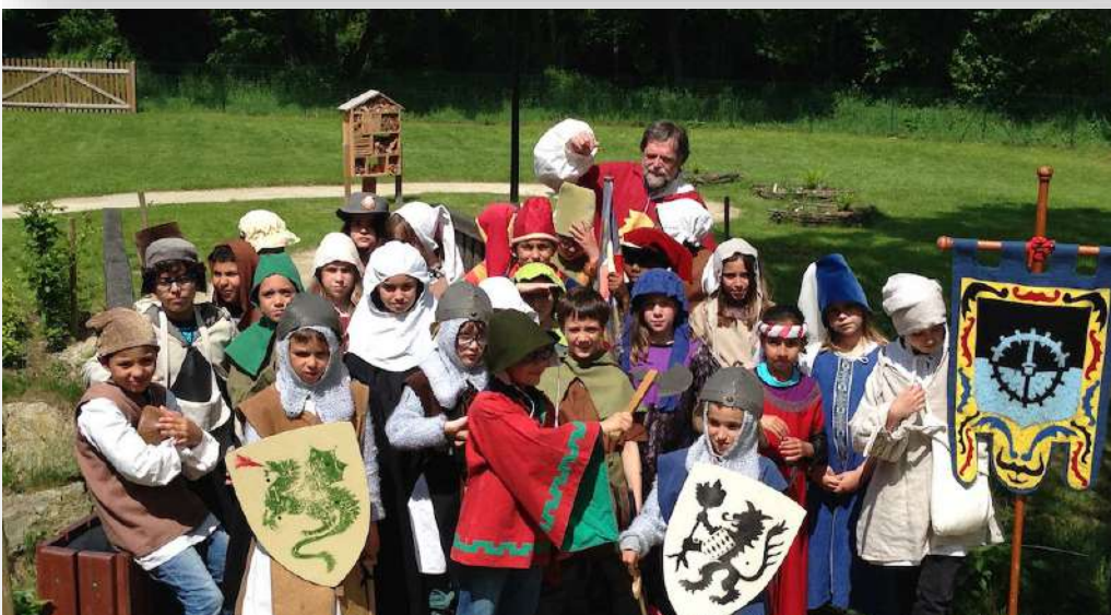
Cité Médiévale – Sainte Suzanne