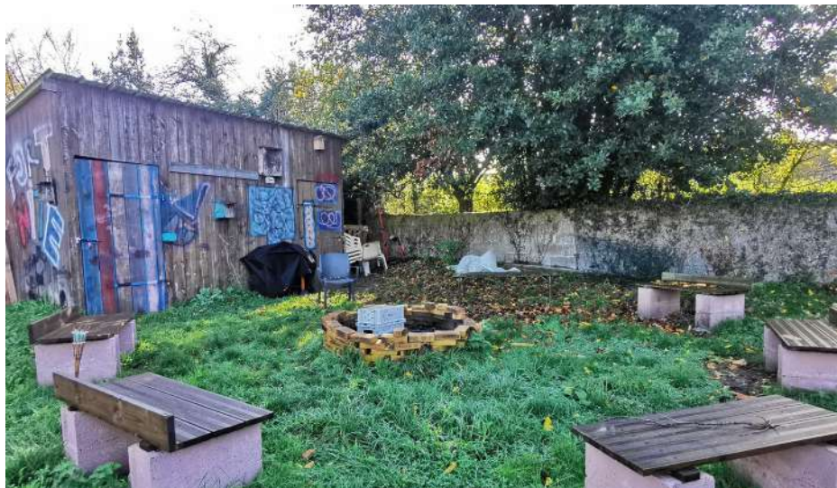
L'endroit des veillées