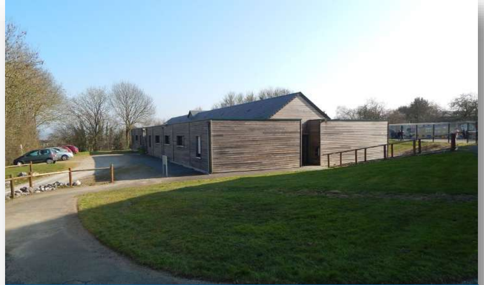
Le centre d'hébergement