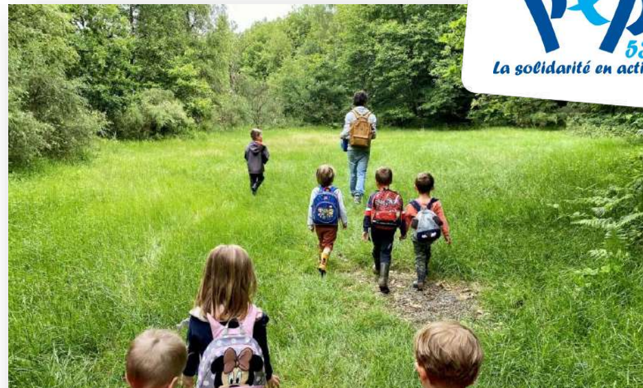
Randonnée à la découverte des animaux