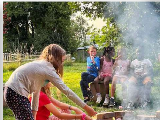
Colonie de vacances