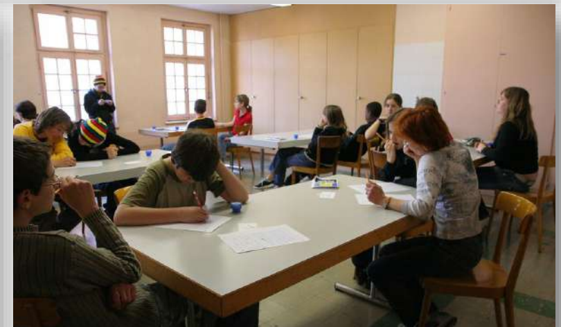
Stage BAFA / BAFD