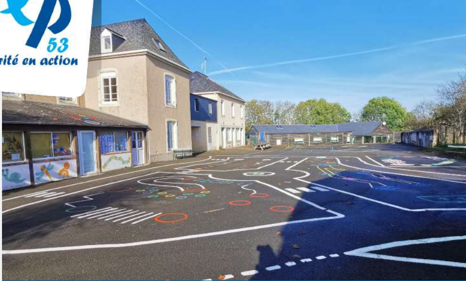
Le bâtiment administratif