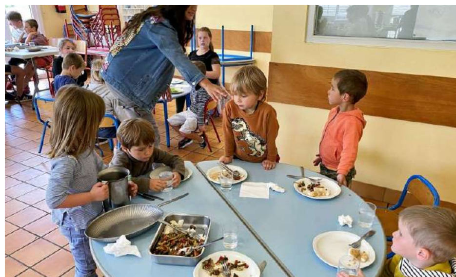
Cuisine et services adaptés à tous les âges