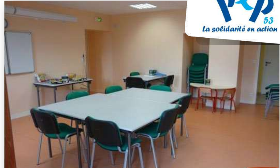
Salle « Nature »

En plus de ces salles d'activités, le centre dispose d'un grand terrain de verdure, d'un jardin pédagogique ainsi que d'une mini-ferme. Le city-stade et ses équipements (tables de ping-pong..) sont attenants au centre et accessibles directement.