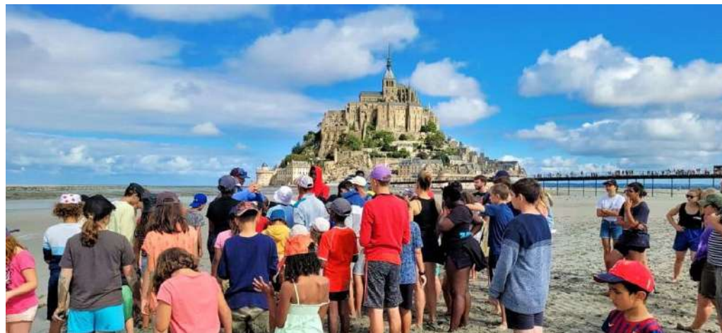
Service de placement dans d'autres centres PEP