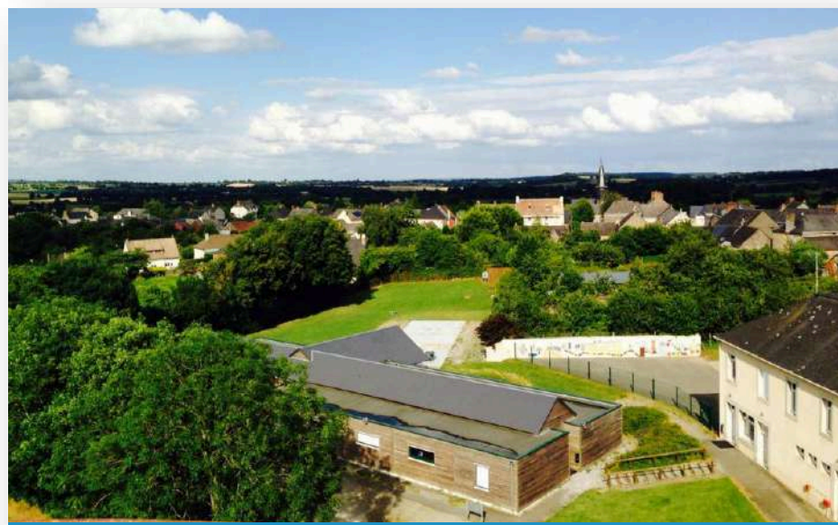
Vue aérienne du centre et du village