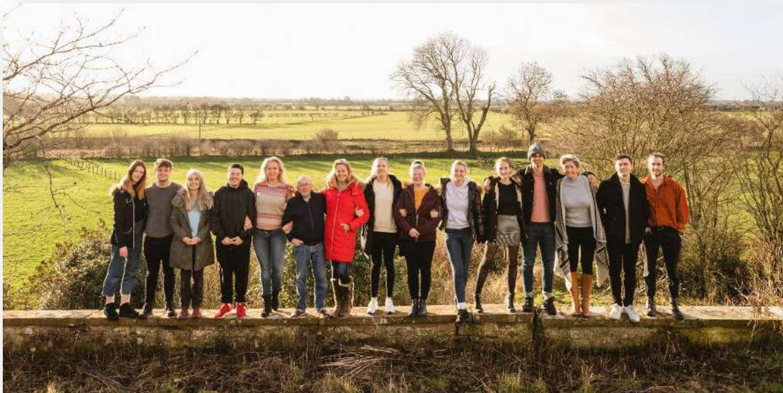
Location du centre en gestion libre