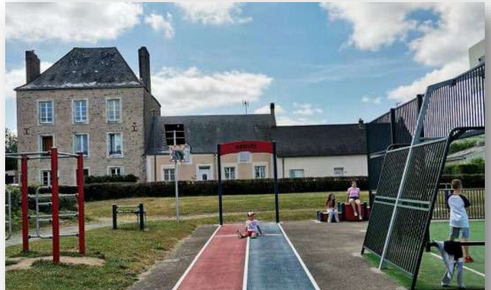
Terrain city stade