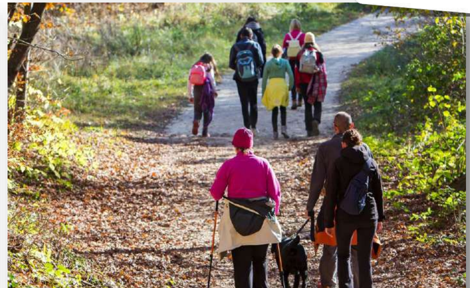
Accueil de groupe