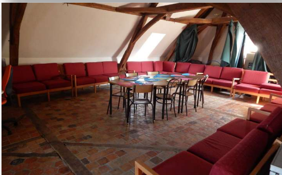
La salle de repos